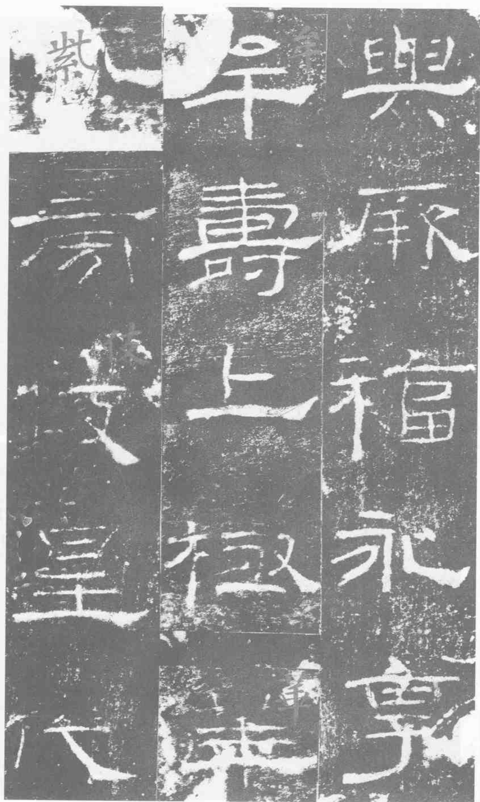
与厥福。永享。年寿。上极华。紫。旁伎皇代。