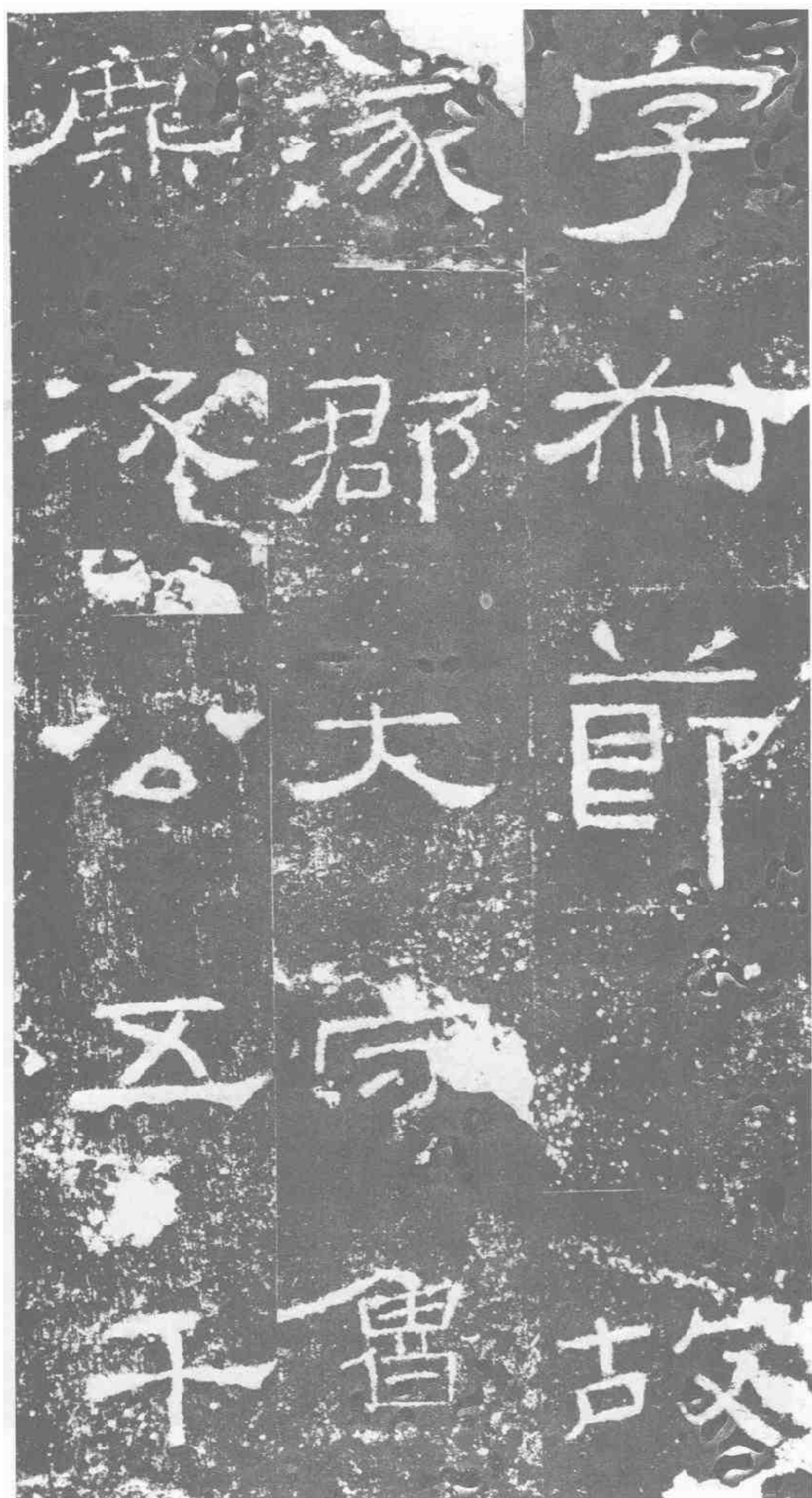
字叔节。故 涿郡太守·鲁· 鹿次公·五千。