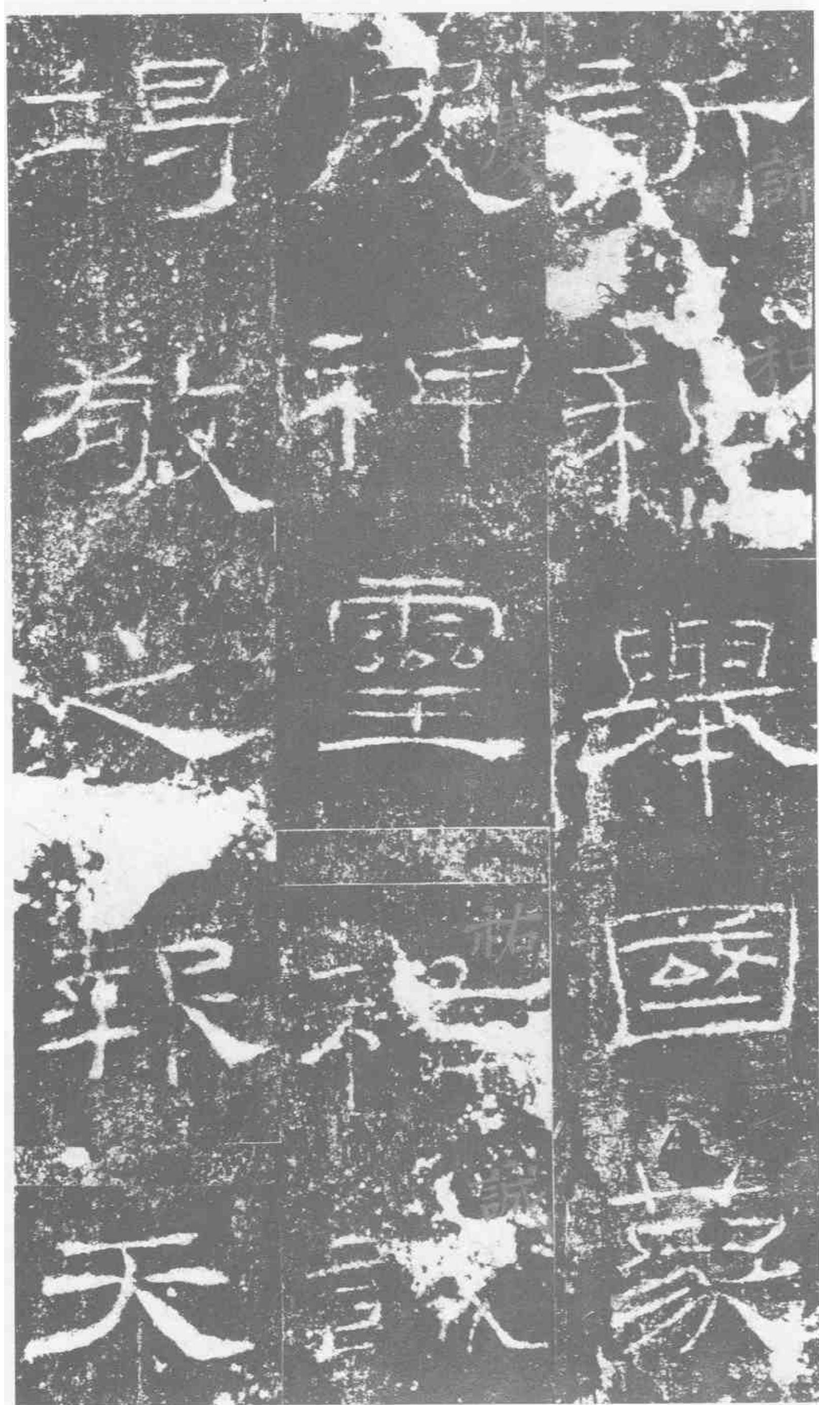
新和。舉國蒙 因。神灵佑誠。 竭敬之報。天