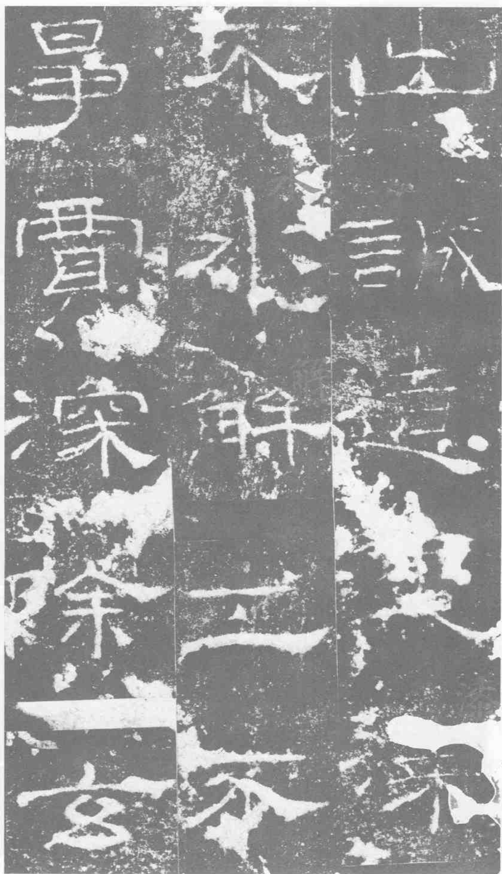
出誠造□。漆 不水解。工不 争賈。深除玄