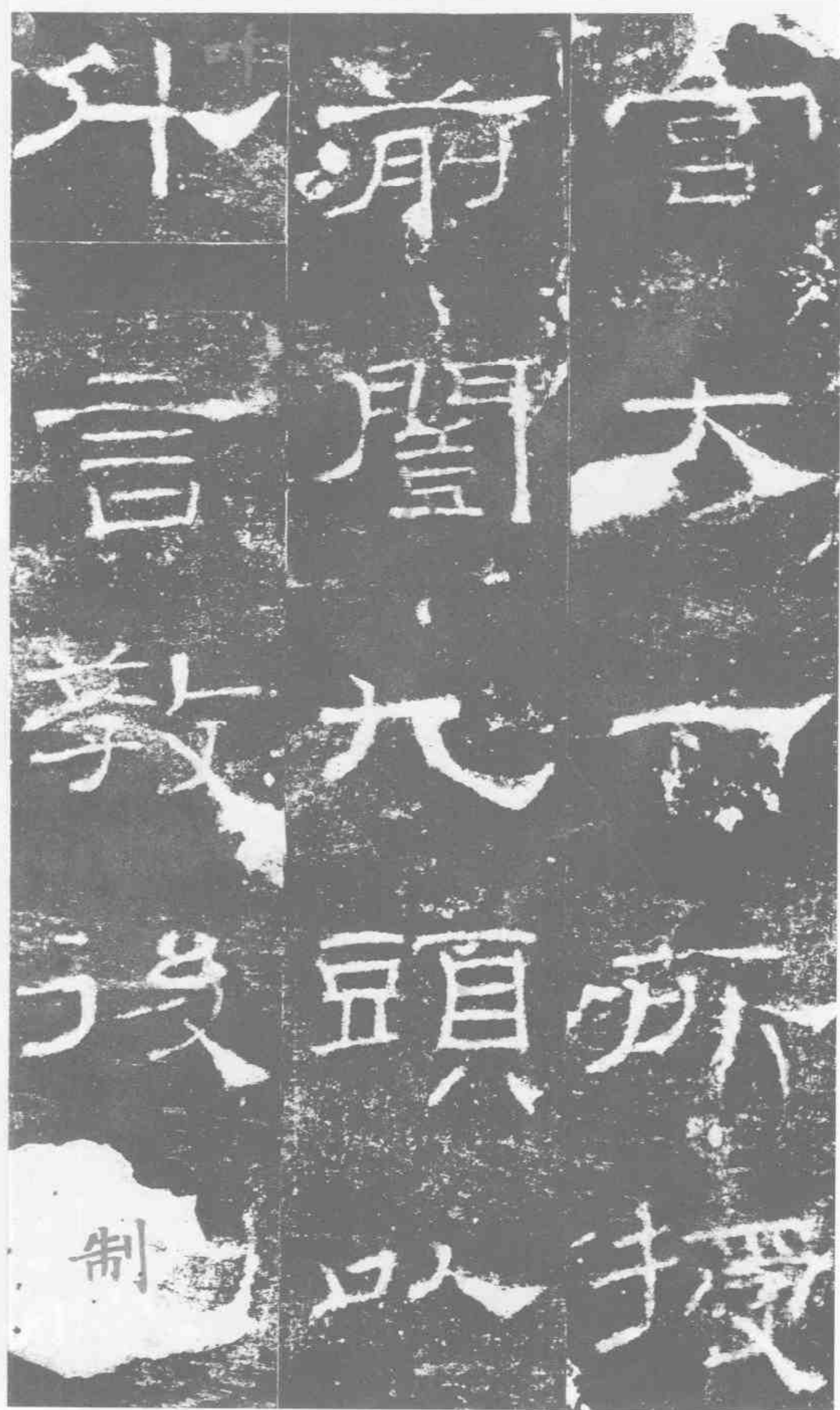
宮。大一所授。前閭九頭。以斗言教。后制