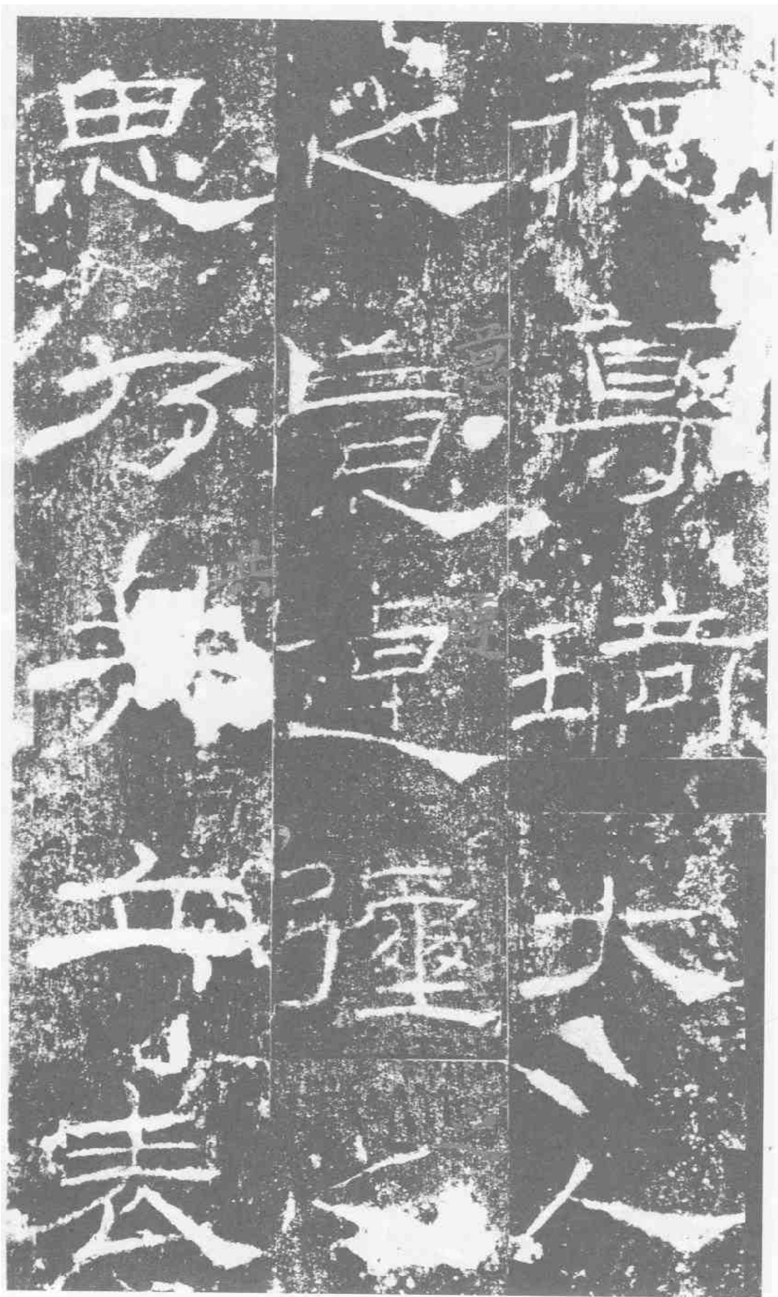
德。尊琦大人。之意。連璧之。思。乃共共立表。