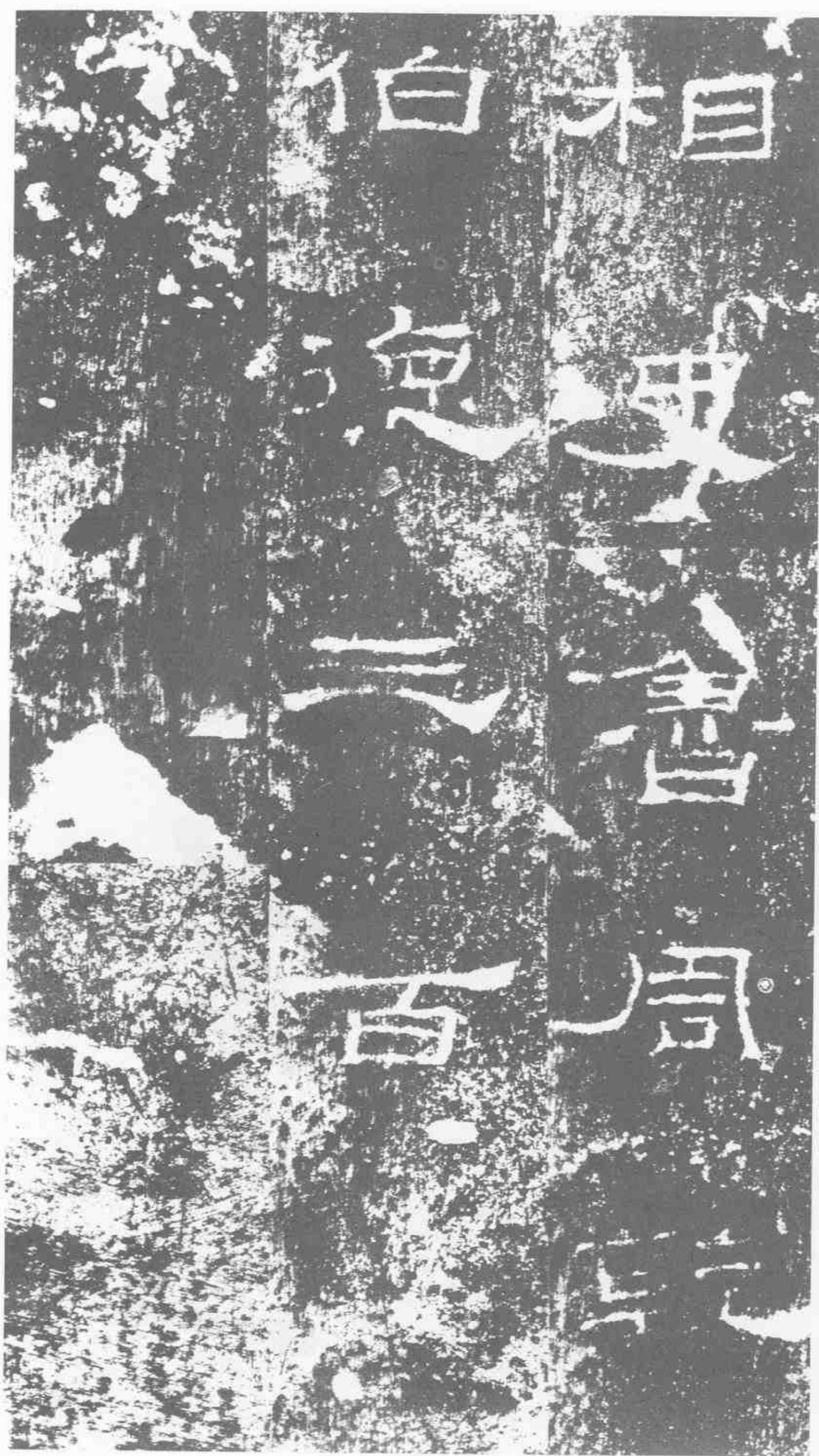
相史·魯·周乾·伯德·三百。