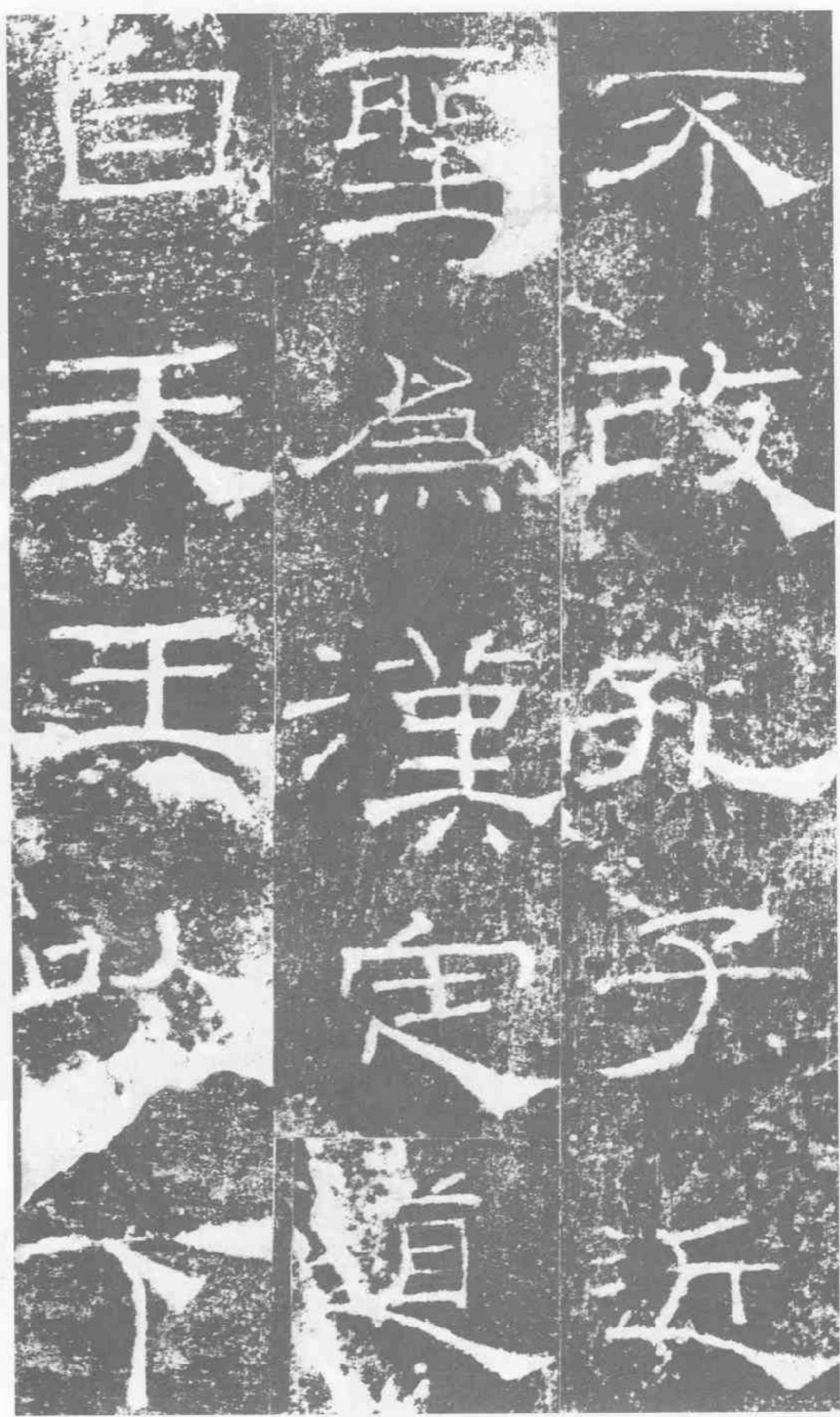
不改。孔子近。圣。为汉定道。自天王以下。