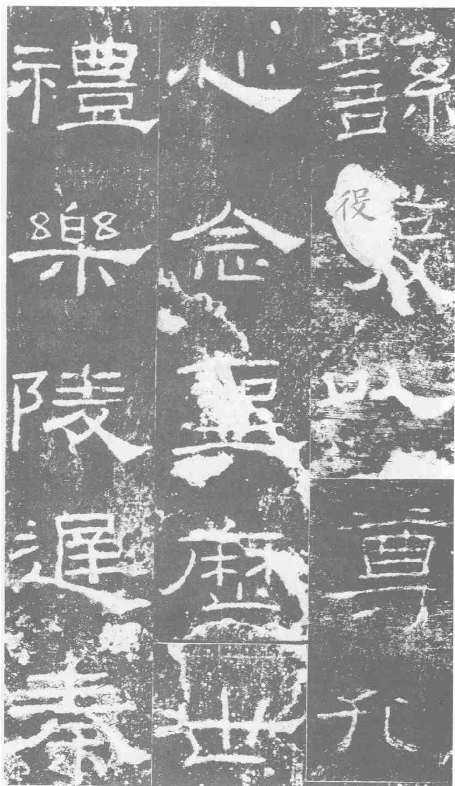
禮發以尊孔 心念聖歷世 禮樂陵遲 秦