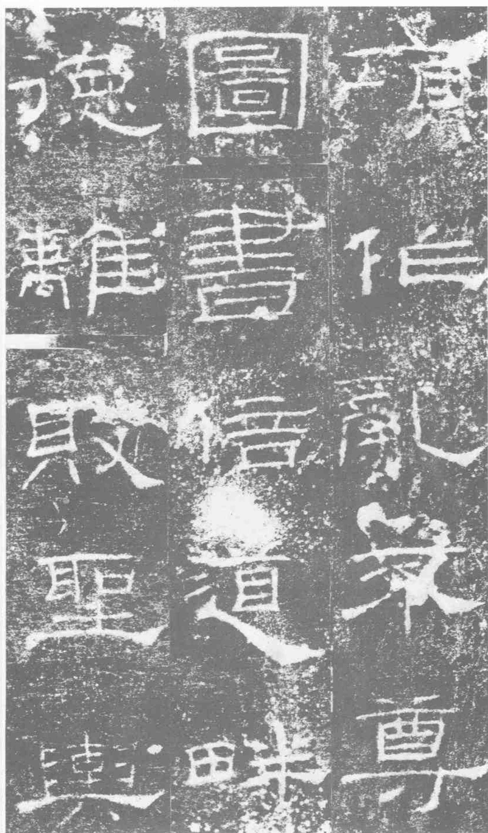
項作亂。不尊。圖書。倍道畔。德。離敗聖興。