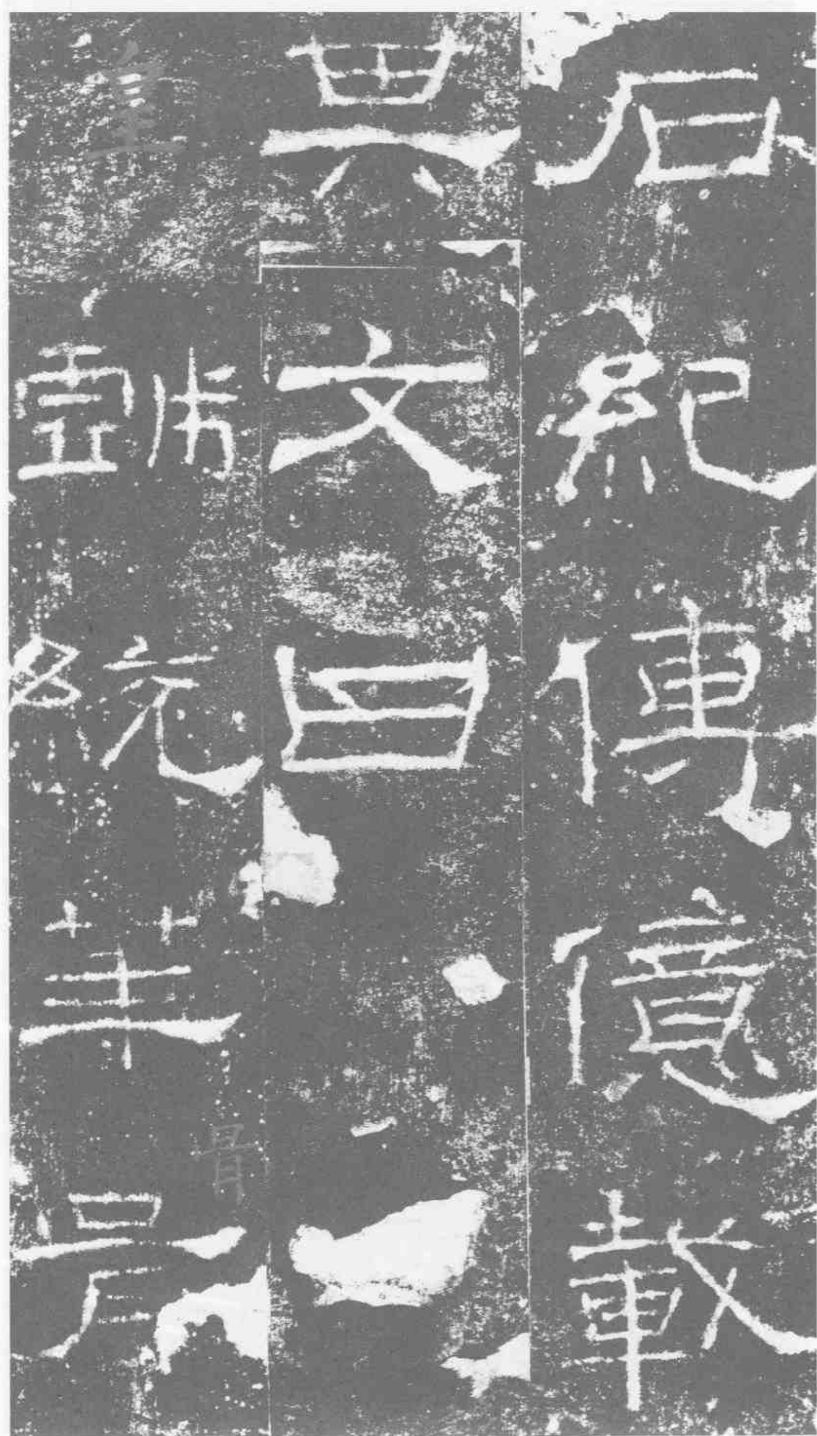
石紀傳億載。其文曰。皇戲統華胥。