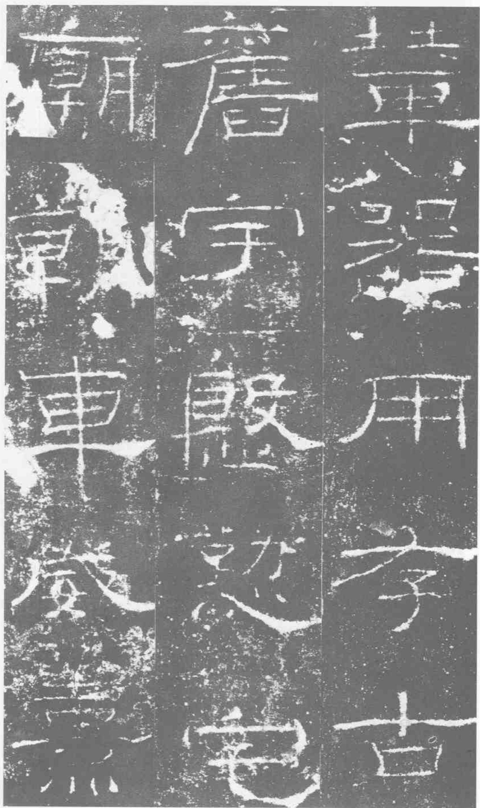
禁器用。存古。旧字。殷勤宅。庭。朝车威熹。