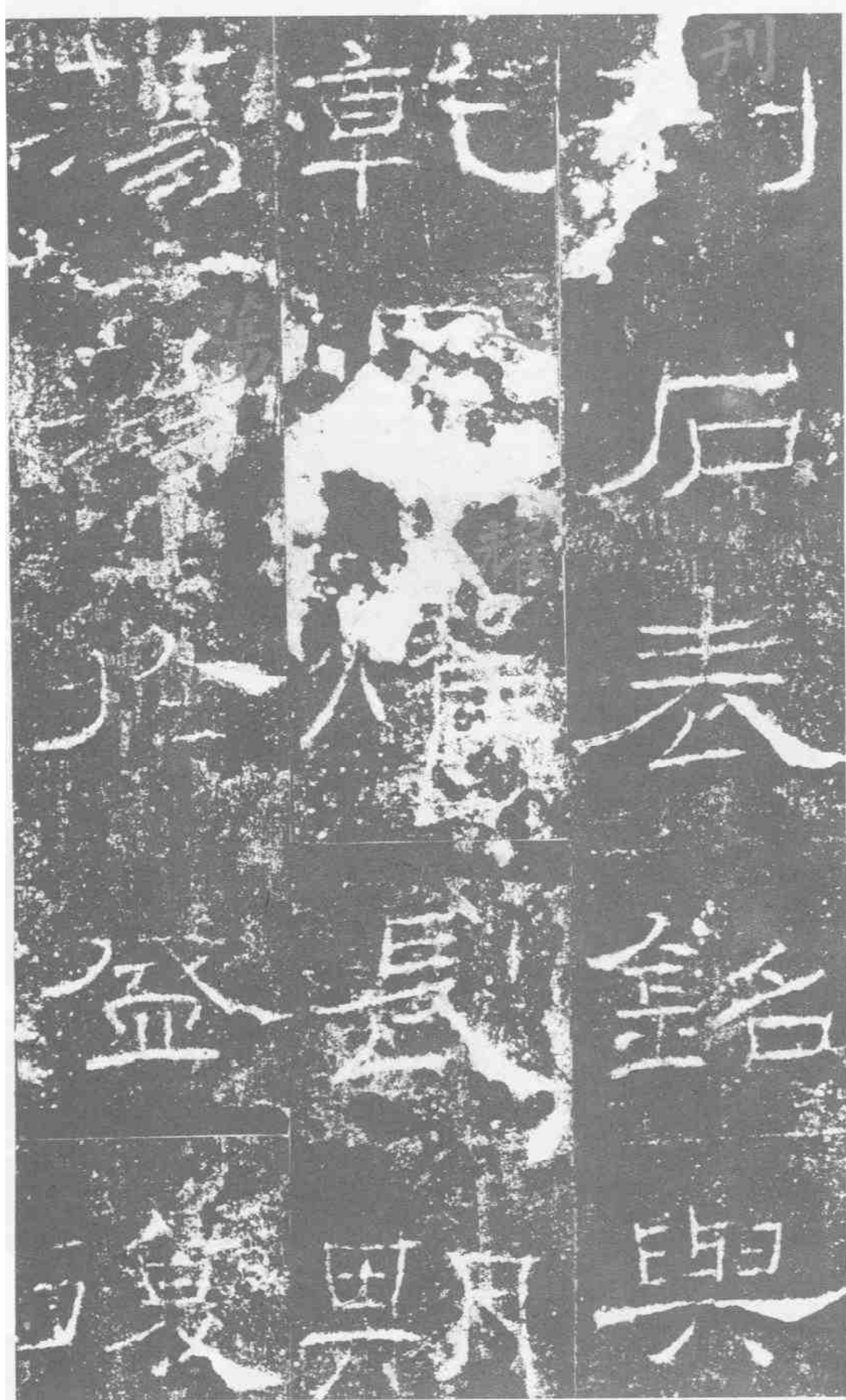
刊石表銘。與 乾「運耀」。長期 蕩蕩。于盛復