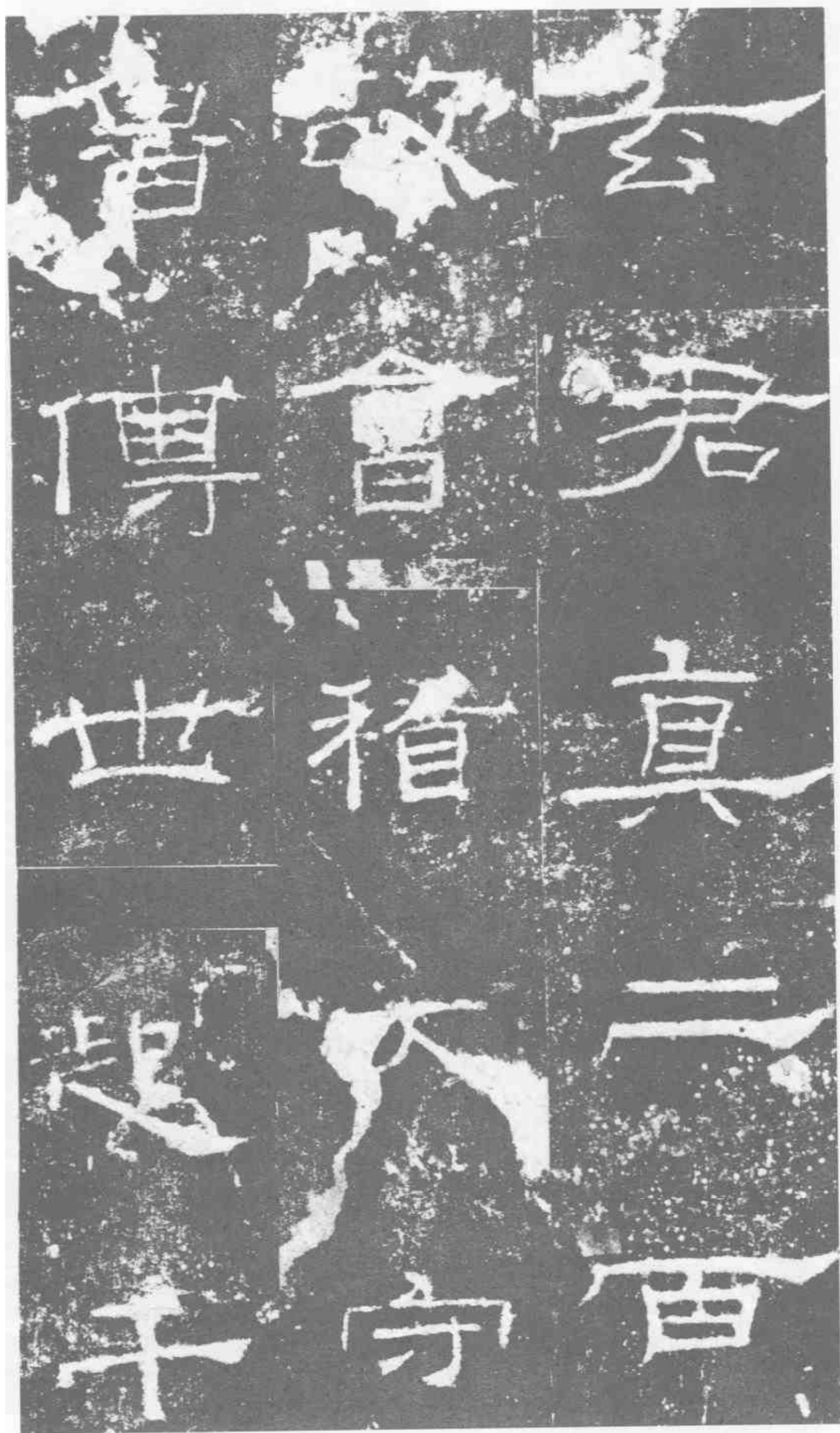
玄君真·二百。故會稽大守·魯·傳世起·千。