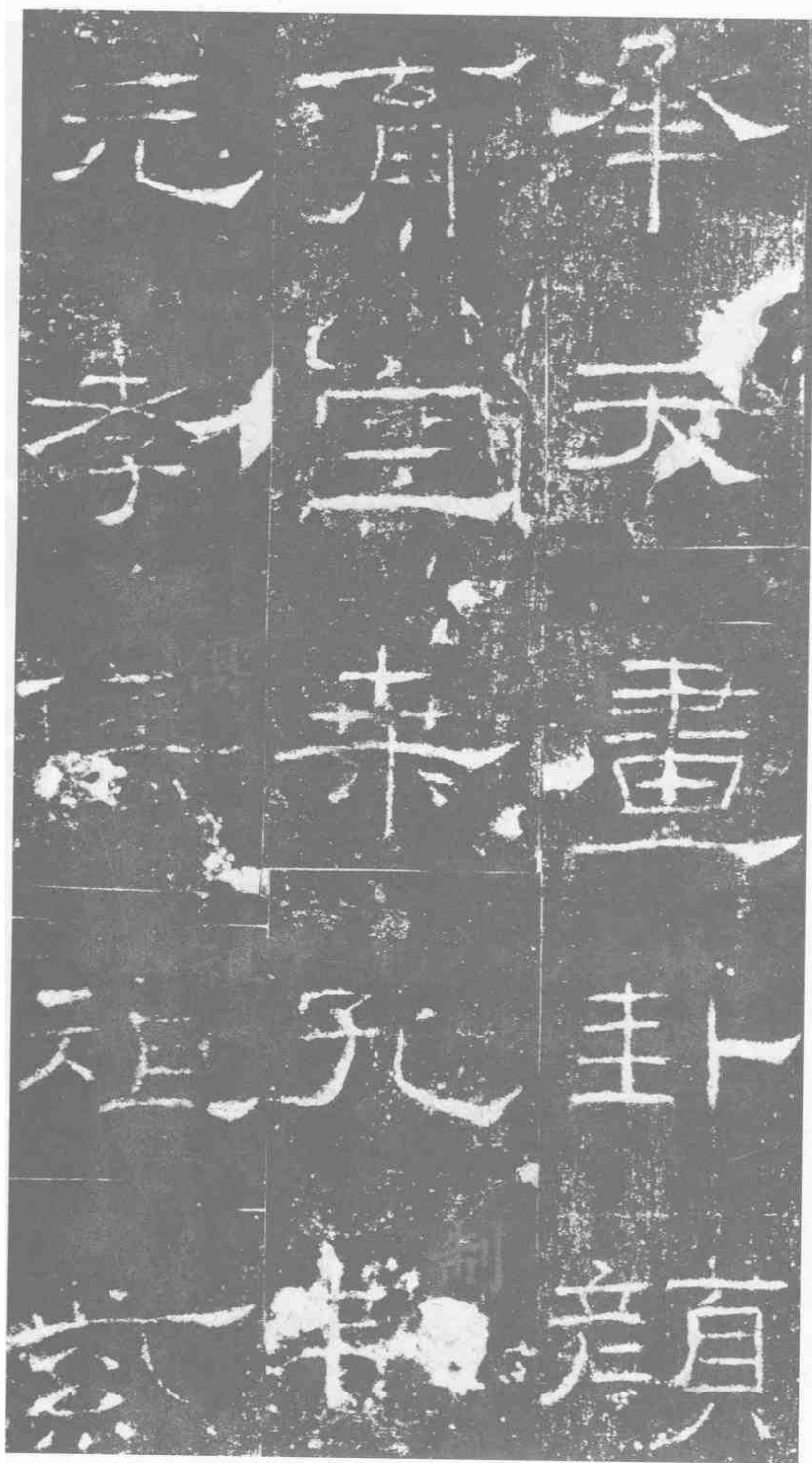
承天圖卦。顏育空桑。孔割元孝。俱祖紫。