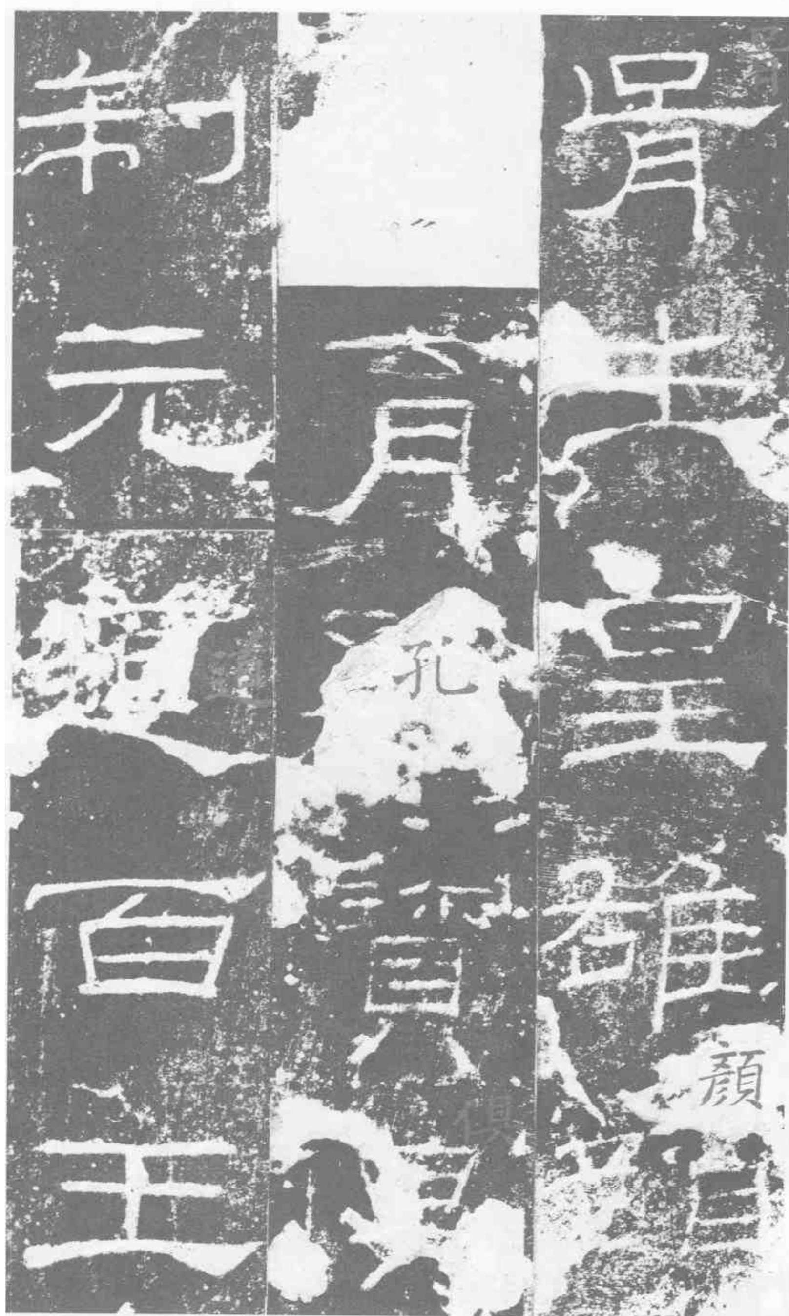
胥生皇雄。顏 □ 育孔寶。俱 制元道。百王