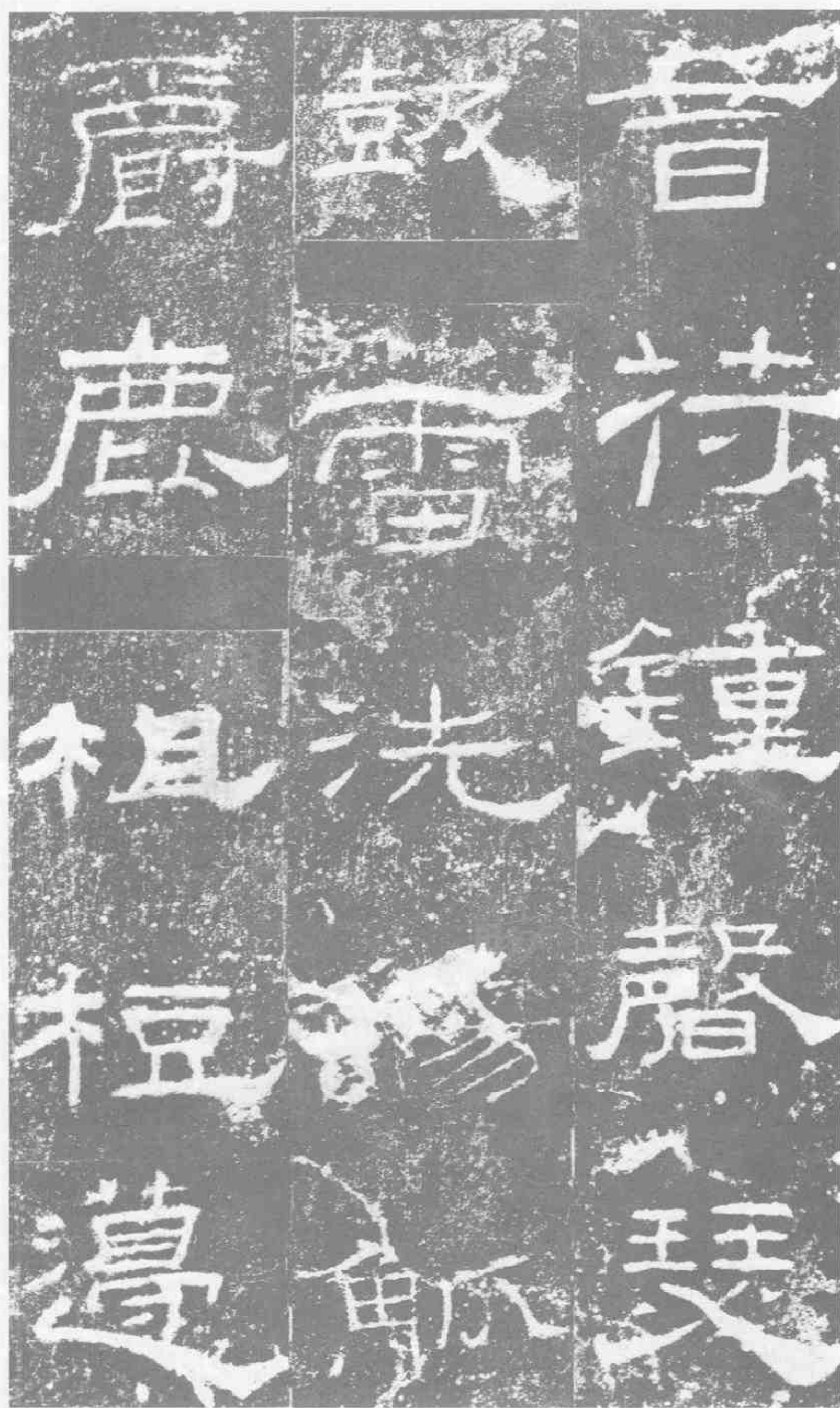
音符。鍾·声·瑟·鼓·雷·洗·觥·觚。爵·鹿·相·桓·筵·