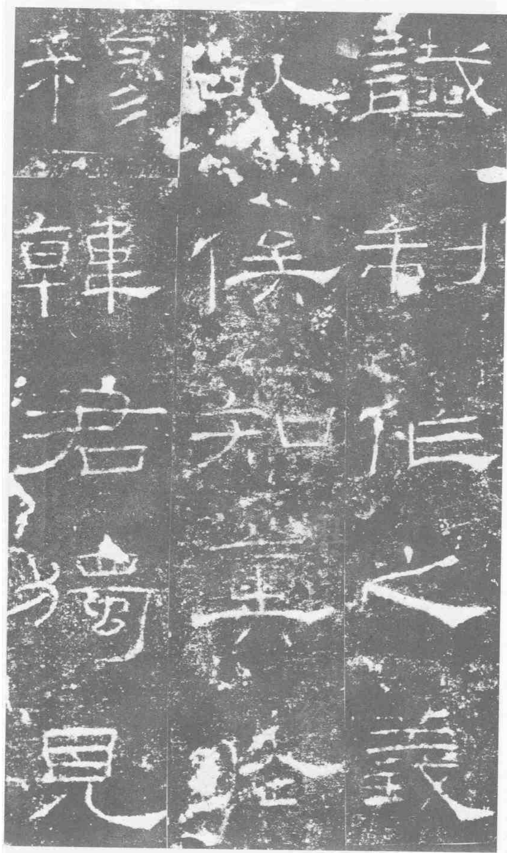
識。制作之義。以俟知奧。于穆韓君。獨見