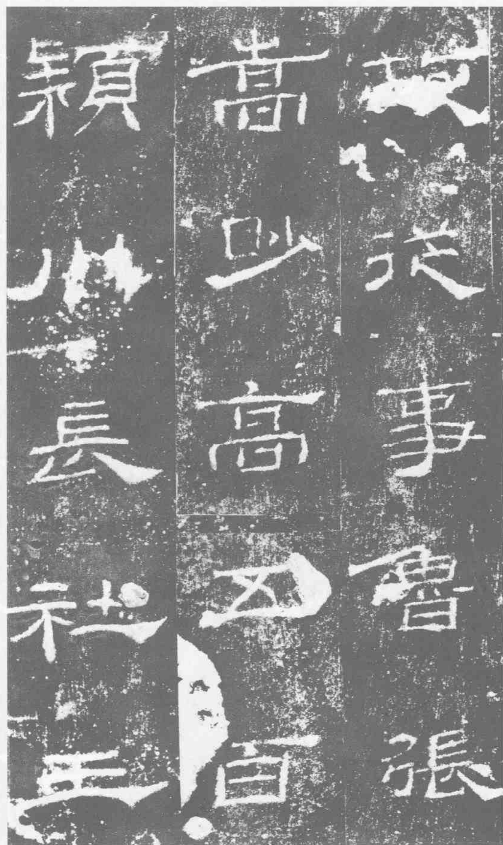
故從事·魯·張 嵩·眇高·五百。 穎川長社·王