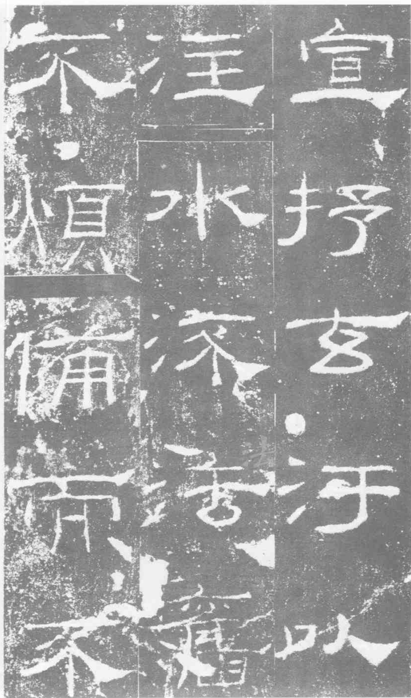
宣抒玄污以注水流法旧不烦备而不