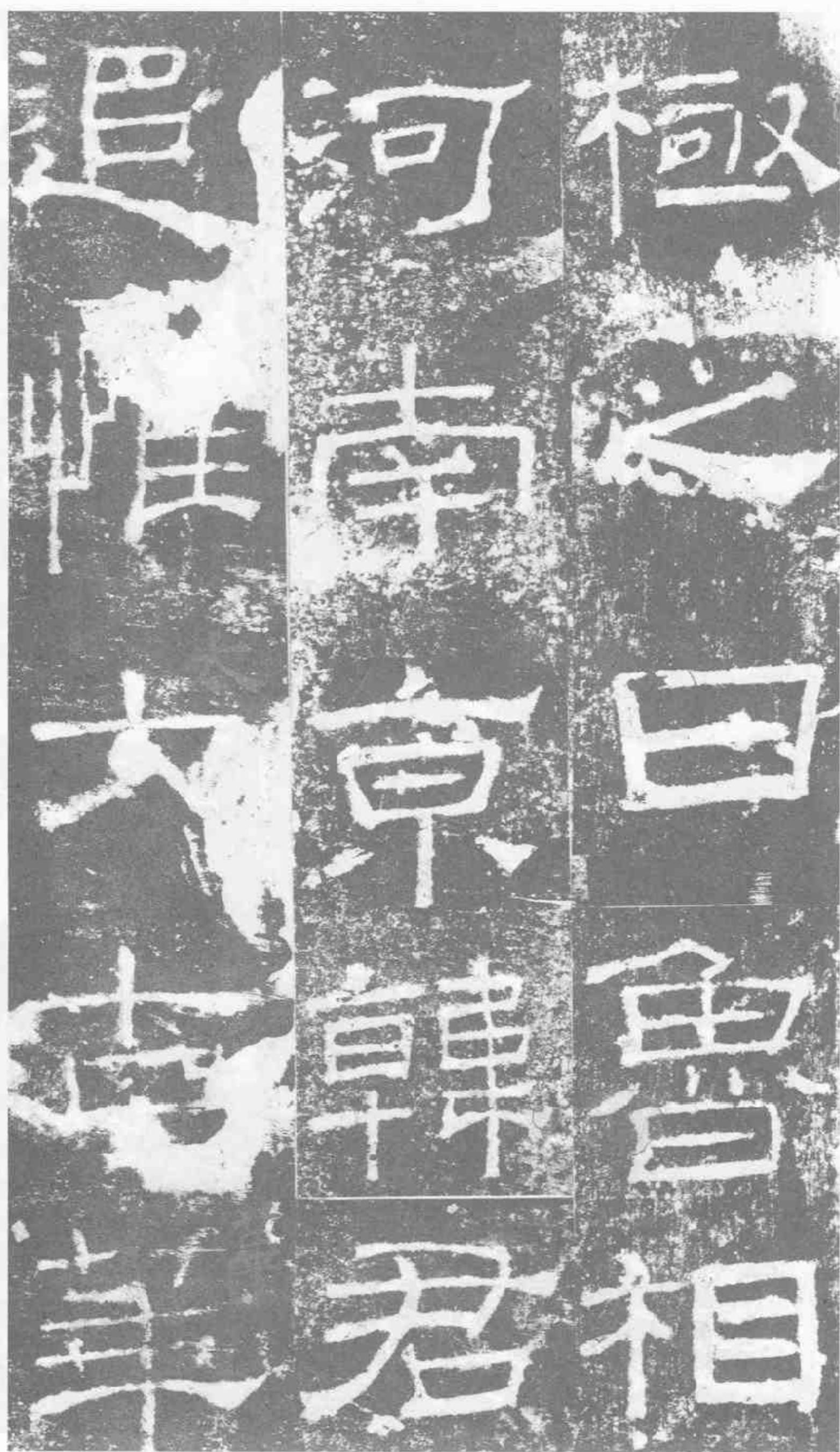
極之日。魯相。河南京。韓君。追惟大古。華