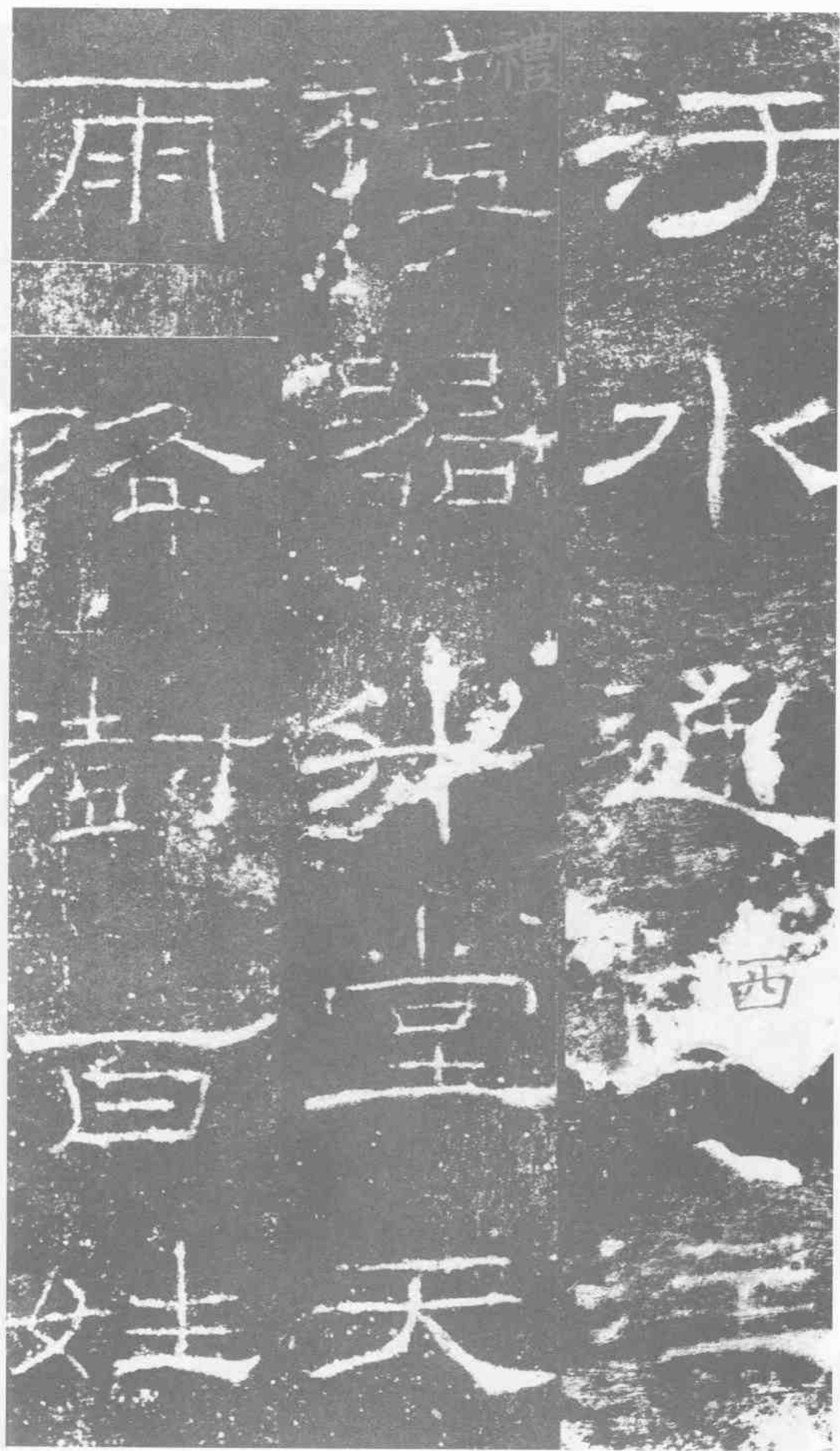
汚。水通四注。礼器升堂。天雨降澍。百姓