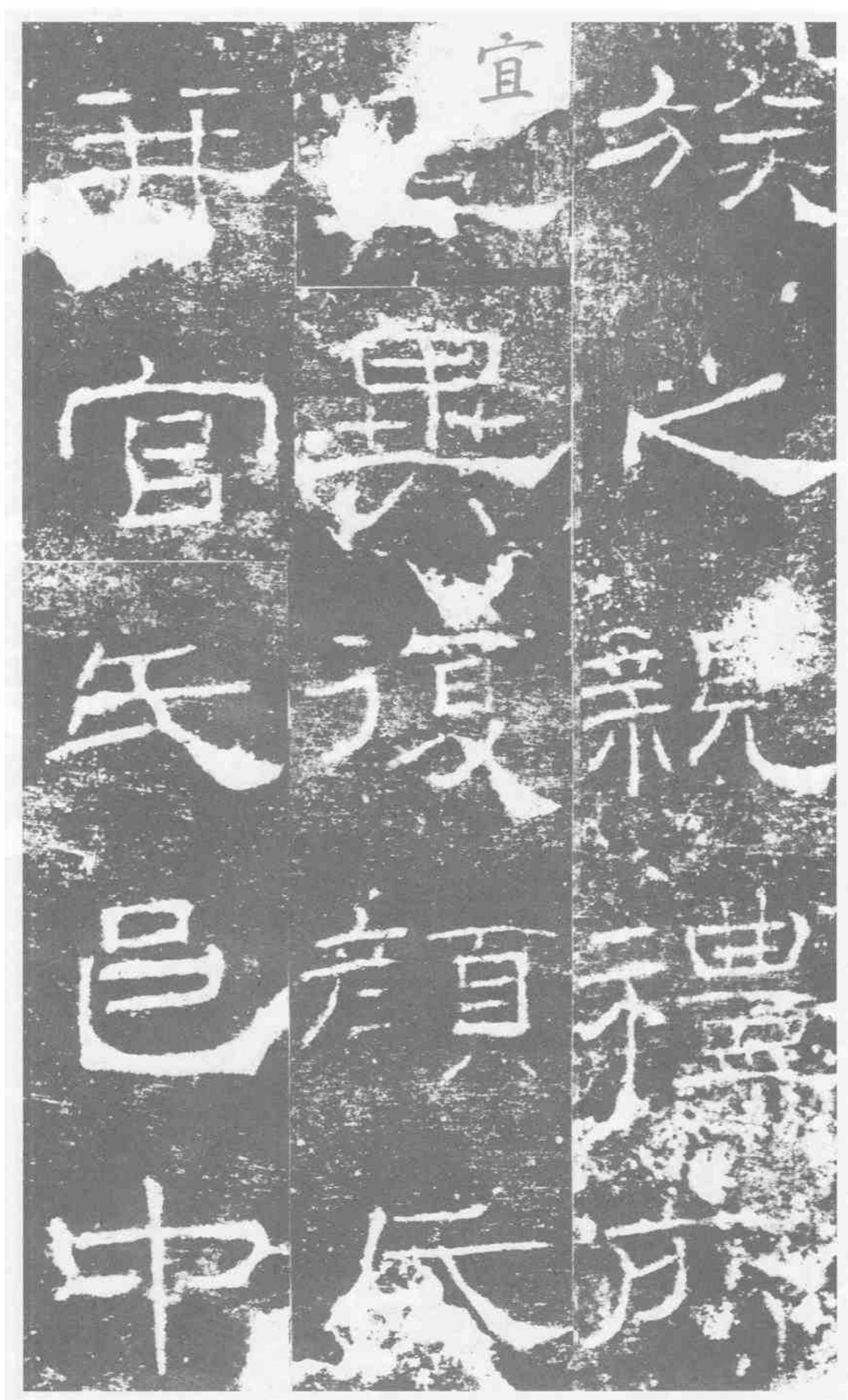
族之親。禮所宜異。復顏氏。并官氏。邑中。