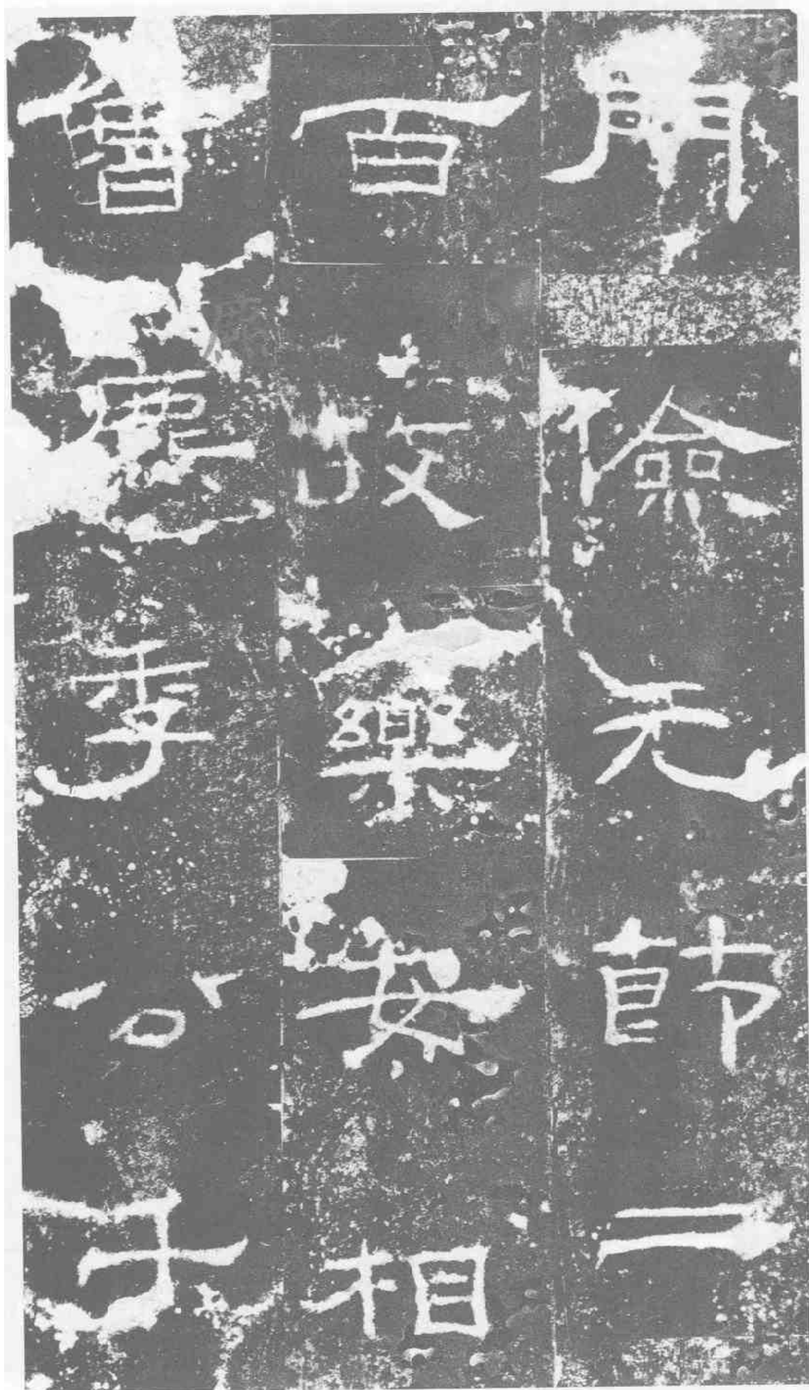
門儉·元節·二 百。故樂安相· 魯·麋季公·千。