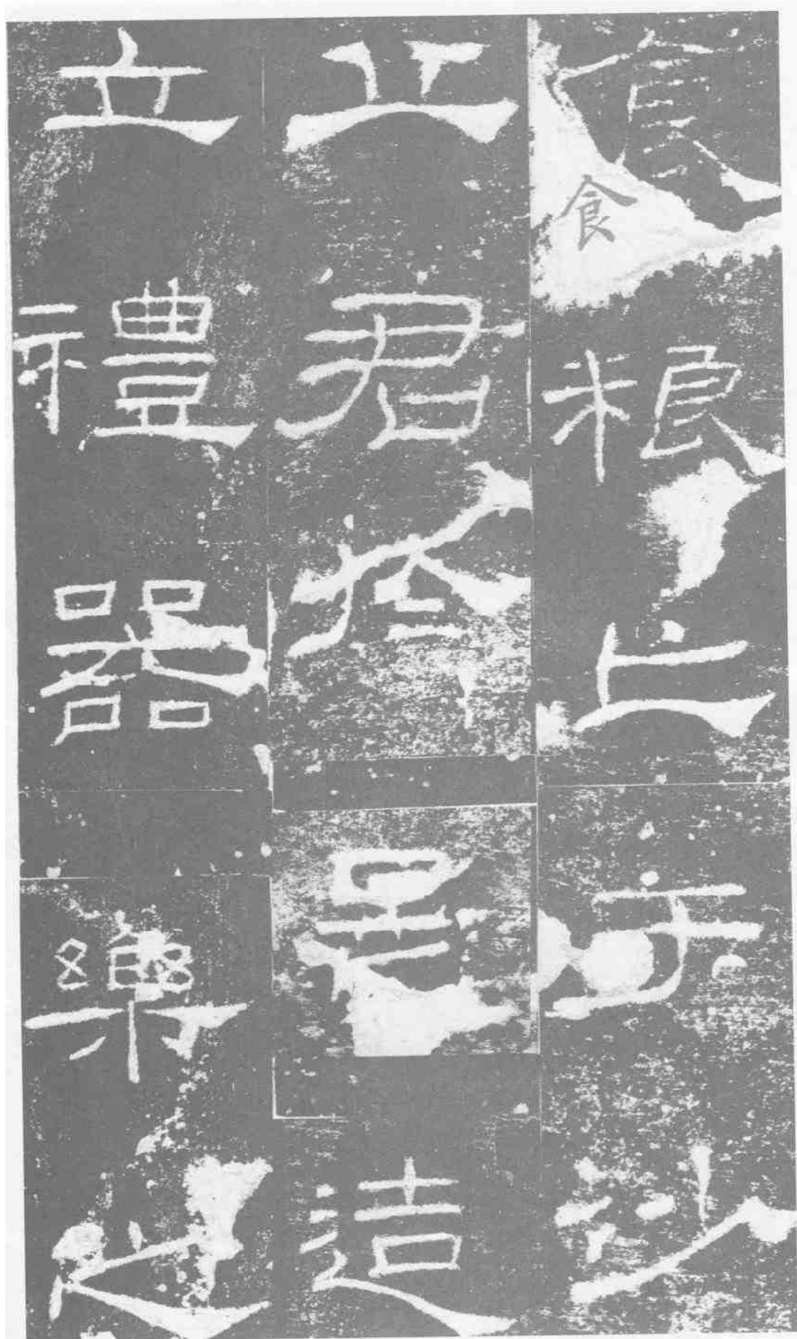
食糧亡于沙丘。君于是造立礼器。乐之。