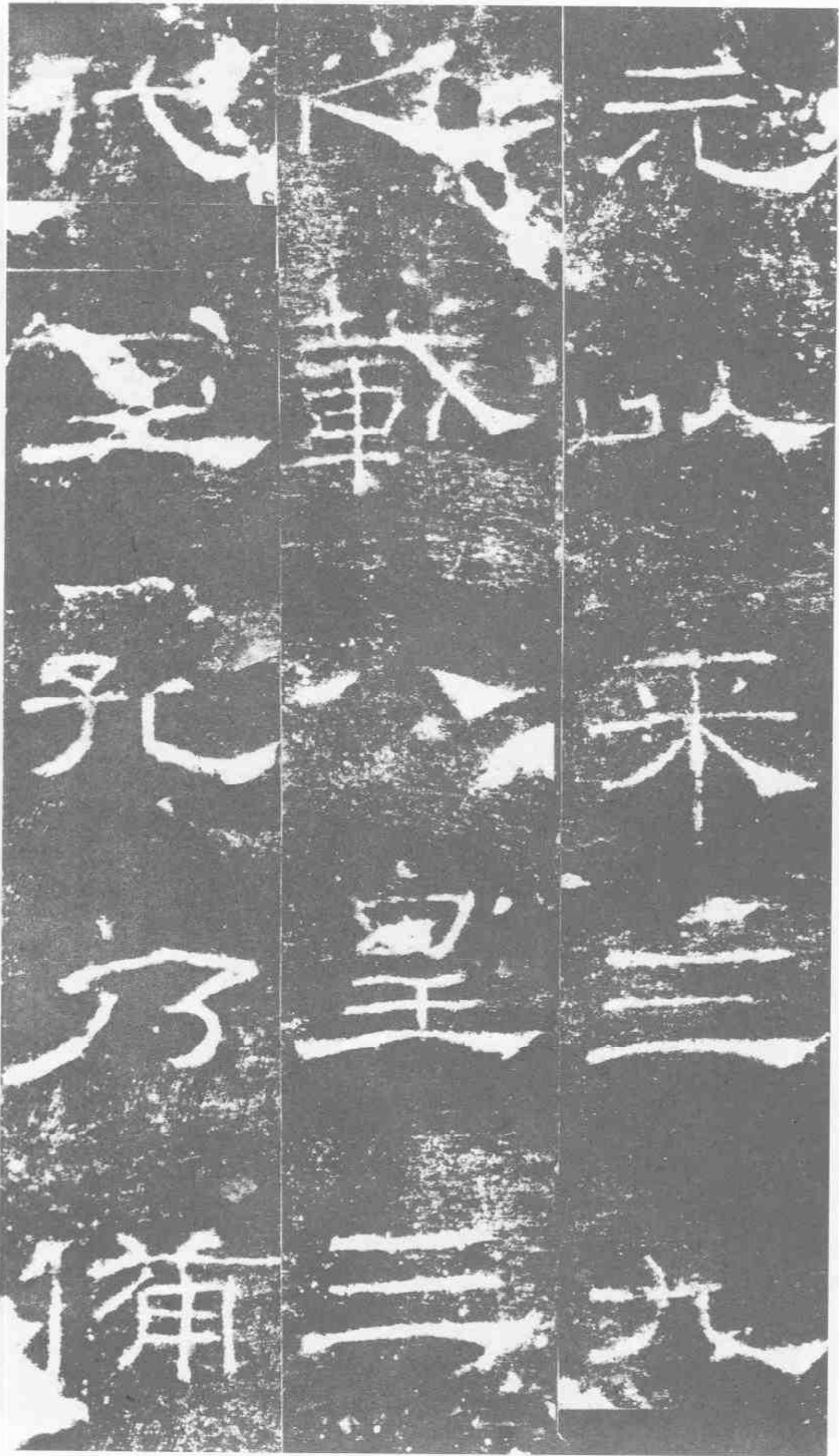
元以來。三九之載。八皇三代。至孔乃備。