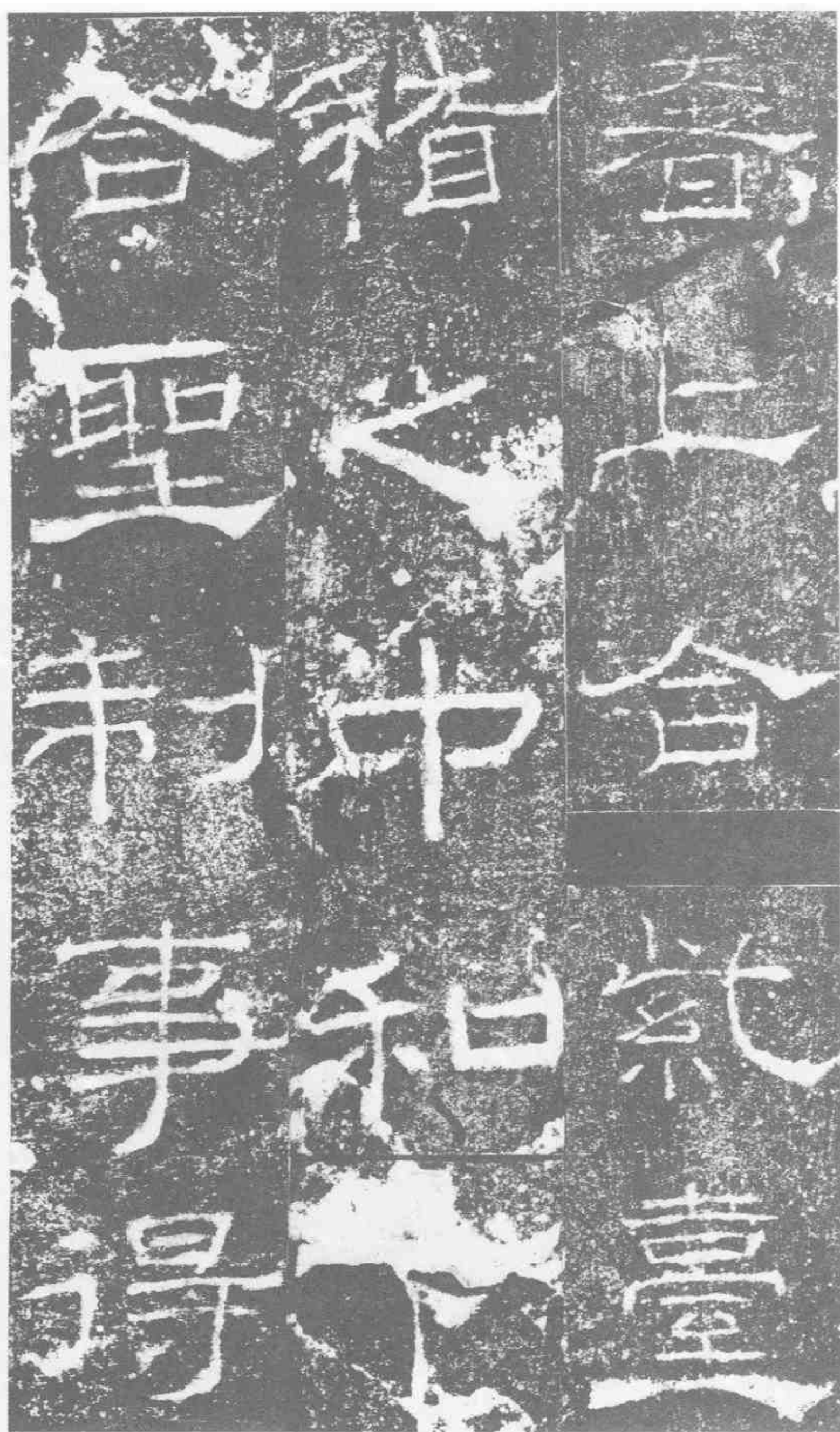
奢。上合紫台。稽之中和。下合聖制。事得。