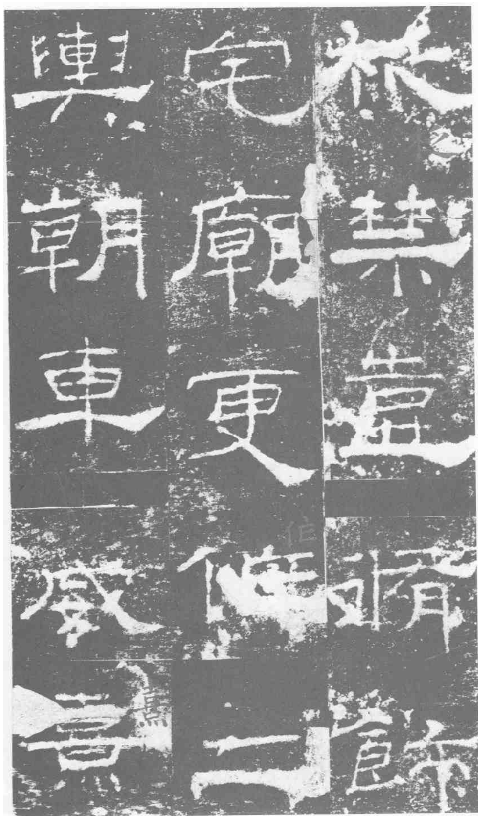
輿：禁。壺。覆修飾。宅。廟。更作二。輿。朝車。威熹。