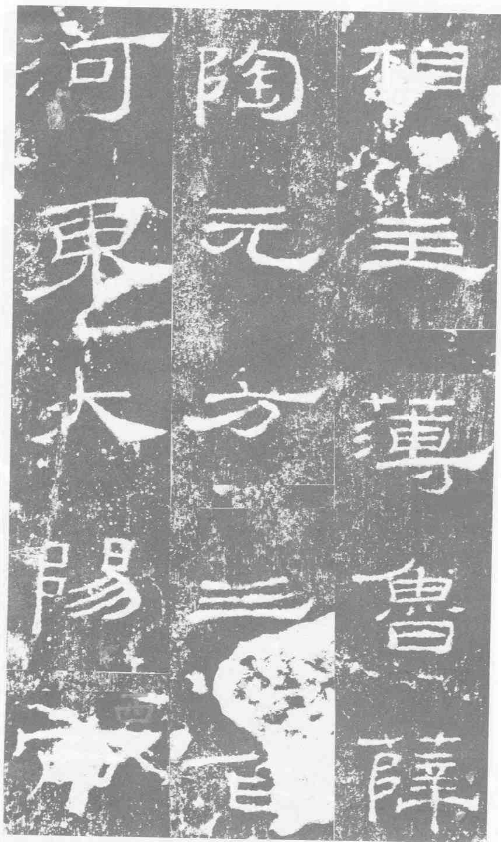
相主簿·魯·薛 陶元方·三百。 河東大陽·西