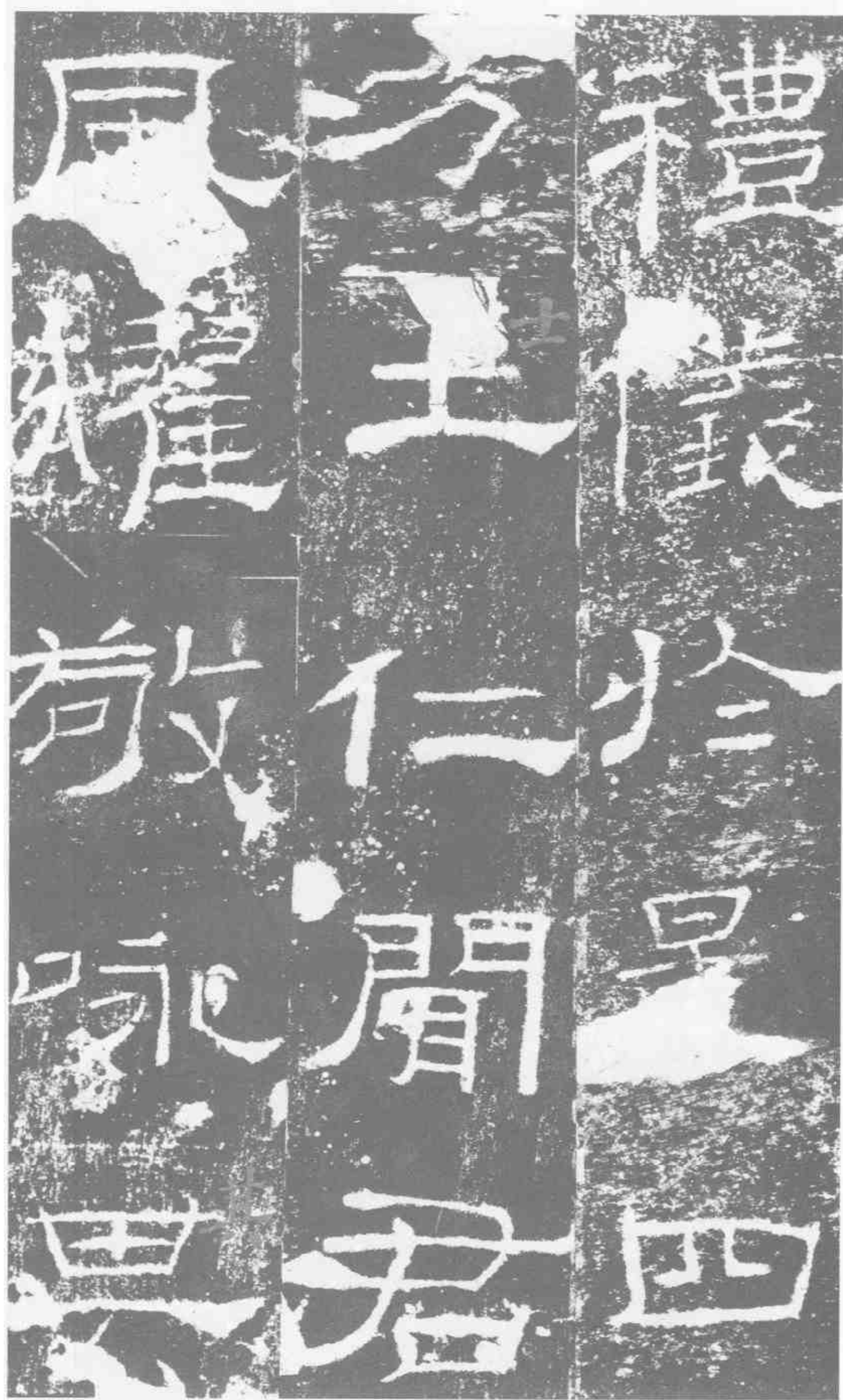
礼仪。于是四 方士仁。闻君 风耀。敬咏其