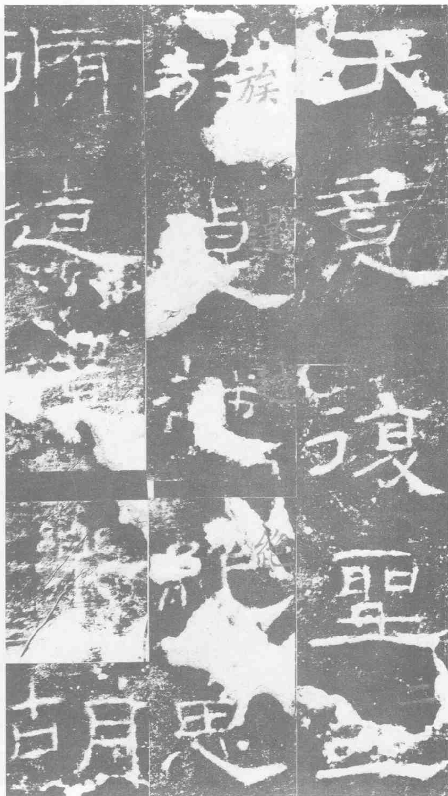
天意·復聖二·族·遠越絕思·修造禮樂·胡