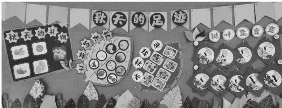
图 7-3-1 “秋天的足迹”主题墙

主题墙在结构上包含主题和子主题板块，在形式上丰富多样，在内容上可包括文字、幼儿作品、过程性照片、图片、资料等。图 7-3-1 是一幅完整的主题墙。该主题墙的主题为“秋天的足迹”，包括“秋天的礼物”“秋天的样子”“寻找秋天”“树叶变变变”等子主题。每个子主题板块由金黄色和咖啡色的叶形纸板、树形纸板组成，秋意浓浓，主题特征十分鲜明。